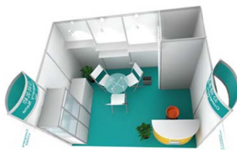
豪华展位（最小 12 平米）