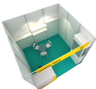
高级展位（最小 9 平米）